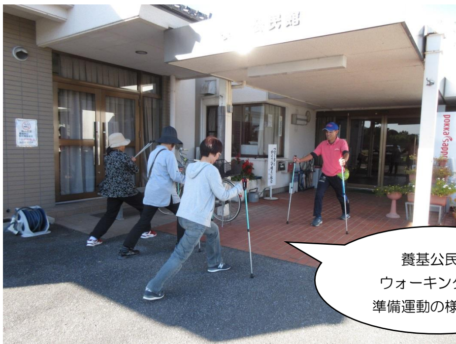
養基公民館 ウォーキング前の 準備運動の様子です