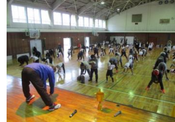
子ども会・家庭教育学級 (4回 各地区公民館及び小学校) 親子ふれあい活動指導