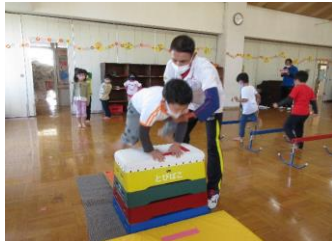
幼児スポーツ教室 (年間88回 公立5園 年長・年中) 柔軟体操・器械運動指導