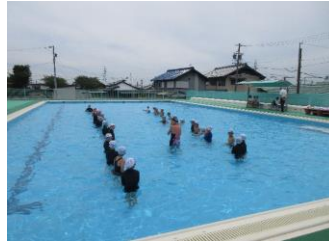
小学生水泳教室 (9回 宮地小学校 養基小学校)