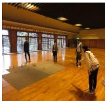
保健センター 特定保健指導運動教室 (全5回 池田町総合体育館)