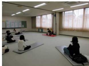
ぴよぴよ広場 ベビーヨガ (2回 保健センター)