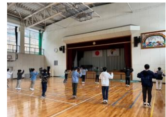
西濃学園中学校ダンス授業 (2回 西濃学園中学校)