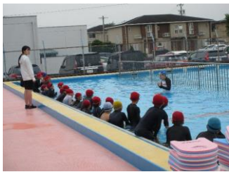
小学生水泳教室 (10回 宮地・養基・池田・八幡)