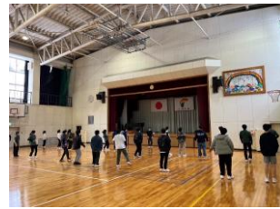
西濃学園中学校ダンス授業 (1回 西濃学園中学校)