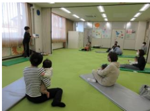
ぴよぴよ広場 ベビーヨガ (2回 保健センター)