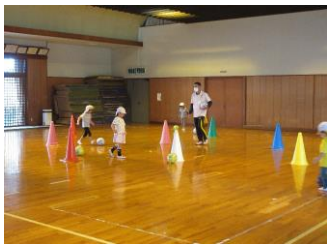
幼児スポーツ教室 (年間132回 公立5園 年長・年中) 柔軟体操・器械運動指導