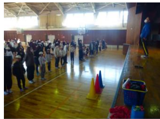
子ども会・家庭教育学級 (4回 各地区公民館及び小学校) 親子ふれあい活動指導